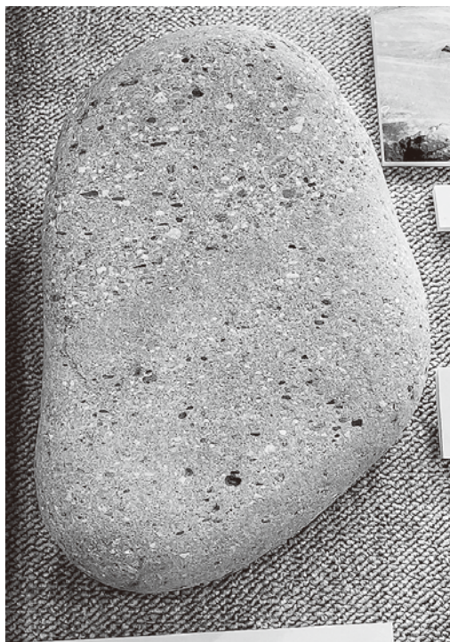
↑↑↑地質館の展示↑↑↑ どこからどうみてもただの石ですが、 人によっては面白い石なのです。

これを読んでいる方は、社会人の方が多いと思いますが、また子供のときに一度行ったきりの博物館を巡られてみてはいかがでしょうか。きっと違う感想をお持ちになることと思います。