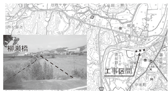
☎ 技術監理係 電話 22-7712