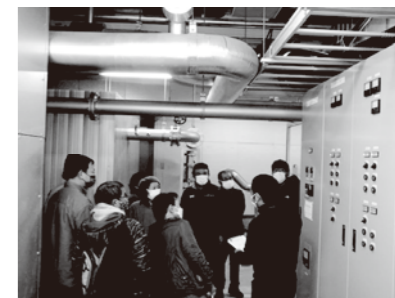
↑舞台の照明機器の説明

今回の開催は未定ですが、今後は幅広い年代の方に参加していただこうと企画中です!こんな催し物がみたい、ここを改善してほしいなど皆様の貴重なご意見もぜひお寄せください。