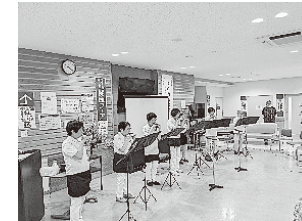
(オカリナ フォルテッシモ)