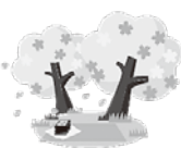
【さくらさいたねっと】