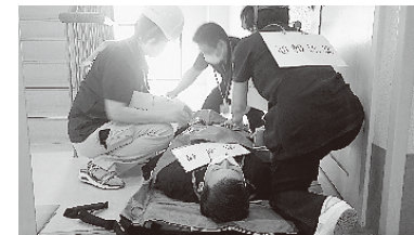
(エアーストレッチャー訓練)

介護老人保健施設希望では、令和6年6月28日(金)に風水害対策訓練を実施しました。台風による大雨で、裏山の土砂崩れが発生し、旧館から新館へ避難するという状況を想定しました。患者・利用者を避難させるため、エアーストレッチャーの取扱い訓練を実施しました。今後も、皆さまが安心して利用できるよう施設として取り組んでまいります。