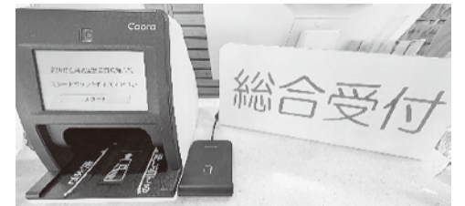
（総合受付 マイナ保険証カードリーダー）

マイナンバーカードをスマートフォンに登録することで利用可能となっていますので、事前にご準備のうえ、ぜひご利用ください。