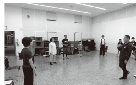
演劇講座練習風景