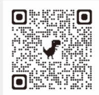
証明書の取得方法