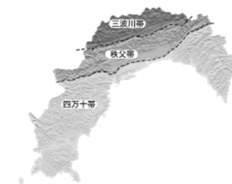
高知県三帯地質図