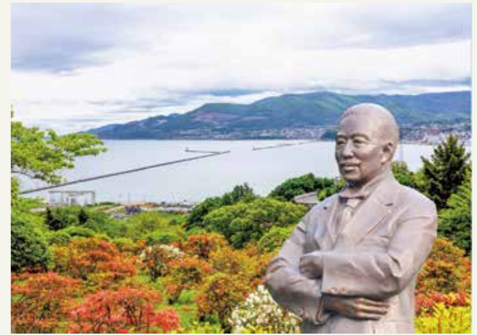
上町にある、佐川文庫庫舎の前に立つ広井勇工学博士像の写真に、北海道小樽港の写真を合成したものです。写真左手前が北防波堤です。