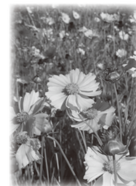
▲オオキンケイギク

(生きたままの運搬・栽培・譲渡は法律で禁止されていますので、お気をつけ下さい。引き抜いた際は、天日にさらし枯らしてから可燃ごみに出しましょう！)