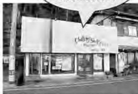
図 チャレンジショップ事務局(佐川町商工会内) 電話 22-0053

〈完全予約制〉 電話：090-8692-6563 http://kairo.p-kit.com/ 営業日：火・金曜日 10時から20時 料金：1時間3,500円 (消費税内税)初診料無し