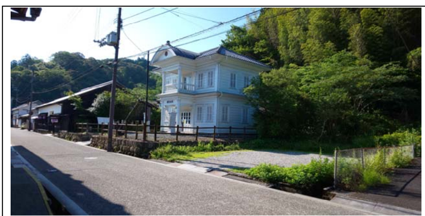
▲建設予定地-2（西から東方向）