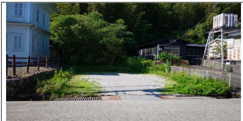
▲建設予定地-1（北から南方向）