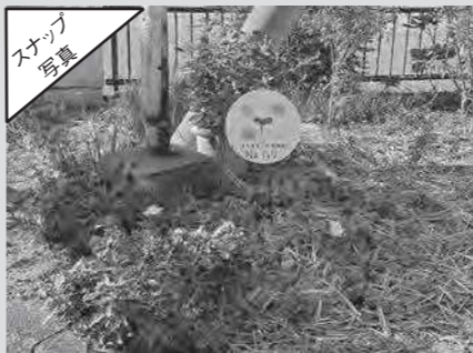
まぢまると植物園(No.117)に登録しました！

【開館時間】 9時30分～17時30分 【休館日】 1月1・2・3・10・17・24・28・31日 月曜・祝日・蔵書整理日 (月1回)・年末年始 【貸出冊数】1人10冊まで 【予約冊数】1人10冊まで 【貸出期間】15日間