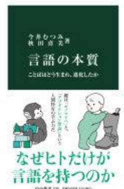
言語の誕生と進化の謎を紐解き、ヒトの根源に迫る。