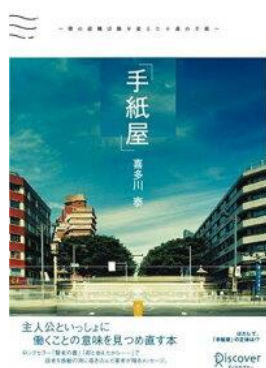
これから社会で働き始める皆さんに読んでほしい一冊