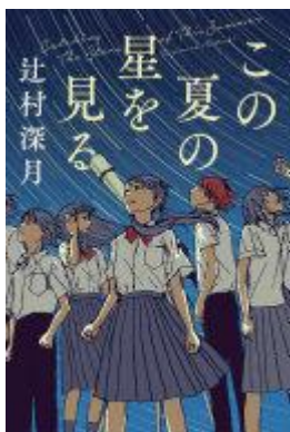
『北海道新聞』等の連載を単行本化