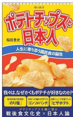
日本人にとってポテチとは… ポテチを軸に語る日本食文化史