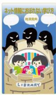
確かな情報で考える術を学べば、鬼に金棒！