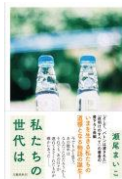
感染症の流行により不自由を余儀なくされた若者の物語