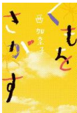
祈りと決意に満ちた初のノンフィクション