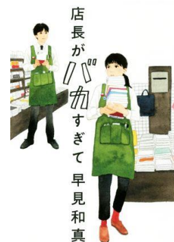
忙しく働く人たちにおくる、元気の出る物語