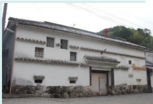
司牡丹酒造(株)焼酎蔵 ▶

司牡丹酒造(株)焼酎蔵を買取り、老朽化により崩れかけている白壁の修理、内外装の整備、耐震補強工事を行い、酒造りの歴史展示施設としての機能を付加する。