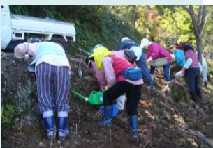
牧野公園に関する文教活動 ▶

佐川町の歴史的風致である「文教」をさらに推進するため、地域における歴史・文化等に着目した「文教活動」を支援する。