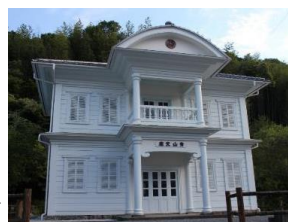
佐川文庫庫舎(旧青山文庫) ▶

佐川町は町内外から「文教のまち」と評されている。これは、江戸期、土佐藩筆頭家老であった佐川領主深尾氏が代々文教施策に力を入れ、その結果、多くの学者や政治家、文化人を輩出したことに由来する。文教の伝統は脈々と継承され、佐川の歴史や人々の心の中に通底している。