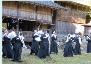
土佐の太刀踊(佐川町太刀踊) ▶

佐川町の歴史的風致である「民俗芸能」の保存・継承を図るため、地域における民俗芸能に関する活動を支援する。