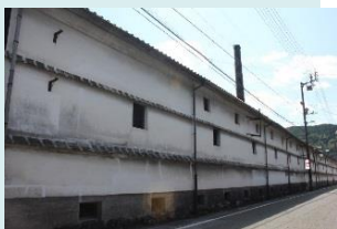
司牡丹酒造(株)1号蔵 ▶

司牡丹酒造(株)の1号蔵を筆頭とした酒蔵群の修復及び保存を行うことで、佐川町の歴史的町並みを構成する重要な建造物として一般公開を図る。